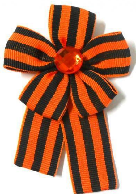
Брошь-цветок № 3