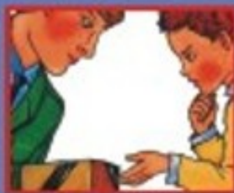
В ТРАНСПОРТЕ- ВОДИТЕЛЮ