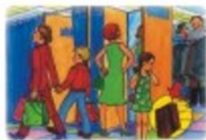
В ОБЩЕСТВЕННЫХ МЕСТАХ