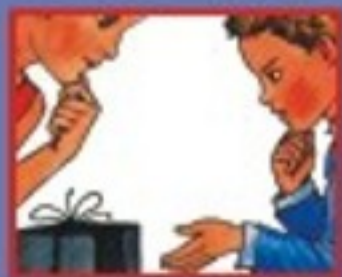
В МАГАЗИНЕ- ПРОДАВЦУ