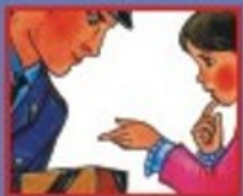
НА УЛИЦЕ ИЛИ В МЕТРО- ПОЛИЦЕЙСКОМУ